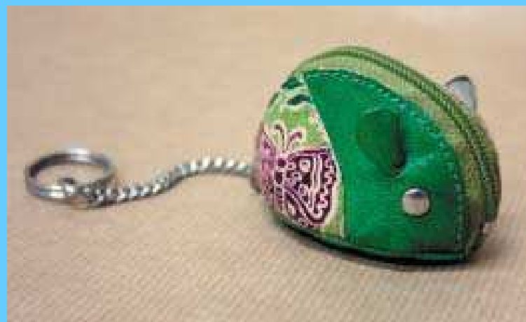
ref.352018 4.00€ LLAVERO CON MONEDERO