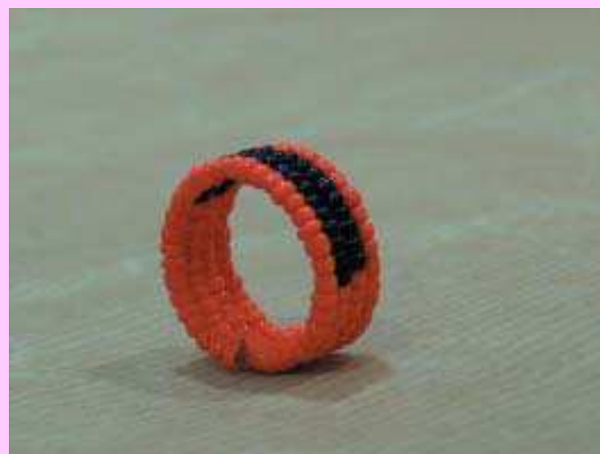
ref.200047 1.50 € ANILLO SERPIENTE