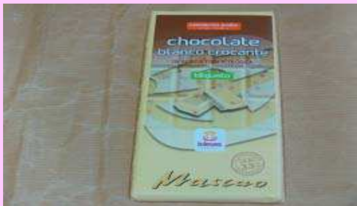
ref.903007 2.50 € MASCAO BIO BLANCO CROCANTE