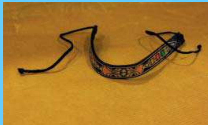
ref.260045 2.50€ PULSERA PIEL RECTANGULOS