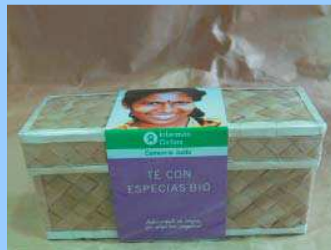
ref. 925012 3.00 € TÉ NEGRO BIO CON ESPECIES