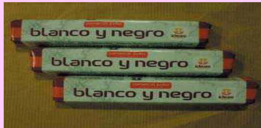
ref.900002 1.50 € CHOCOLATINA BLANCO Y NEGRO