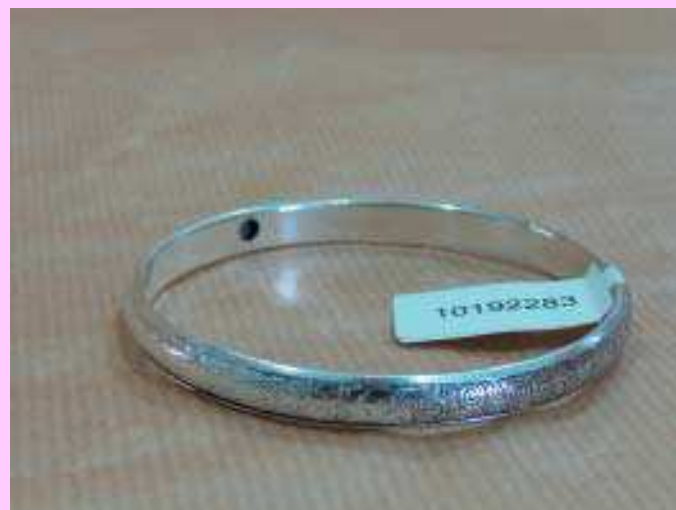
ref.260105 2.50 € PULSERA METAL CON DISEÑO GRABADO