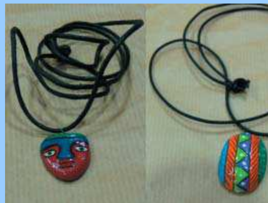
ref.220038 2.00 € COLGANTE FIGURAS CERÁMICA