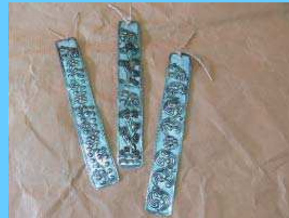
ref. 440004 2.00€ MARCAPÁGINAS ALUMINIO