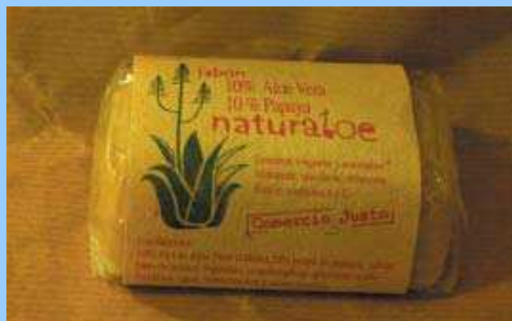
ref. 820013 3.00€ JABÓN ALOÉ VERA Y PAPAYA