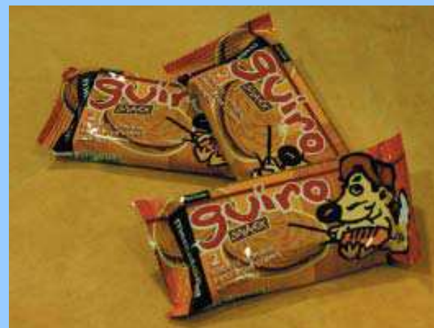
ref.950002 1.00€ GUIRO SNACK