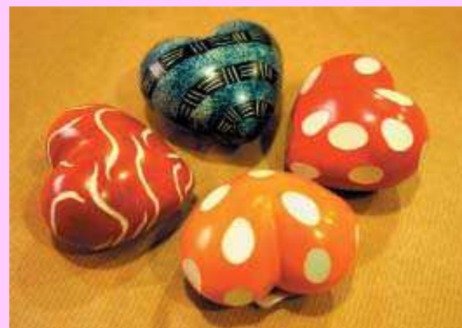
ref. 120047 3.50€ PISAPAPELES CORAZÓN