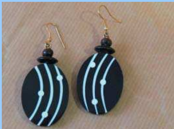
ref. 240116 3.50 € PENDIENTES DE CUERNO Y RESINA