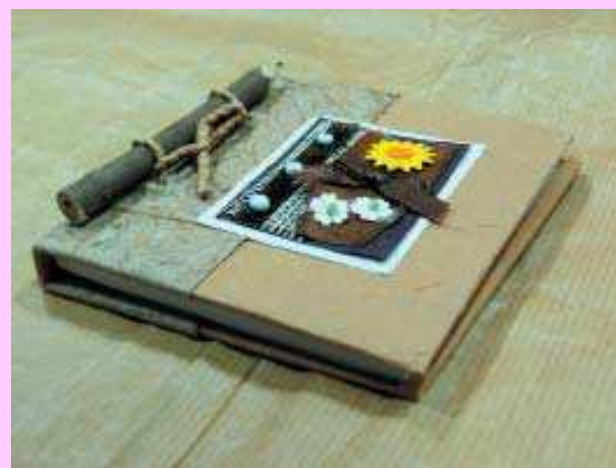
ref. 400033 3.00 € MINI LIBRETA CON SU LÁPIZ