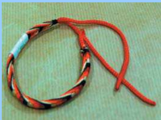
ref.260102 2.50€ PULSERA MACRAME PLANA