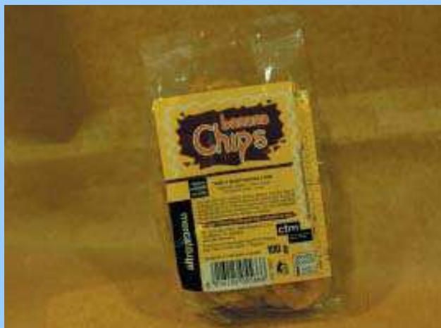
ref.954003 2.00 € CHIPS DE PLÁTANO