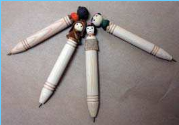
ref. 420005 3.00€ BOLIGRAFO MADERA CON MUÑEQUITOS