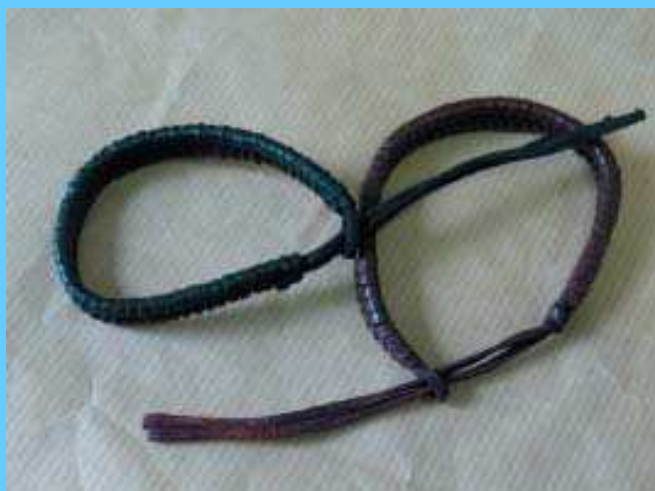
ref.260027 3.50€ PULSERA CUERO TRENZ