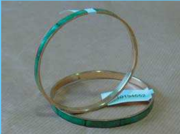
ref. 260109 2.00 € BRAZALETE METAL CON NACAR VERDE