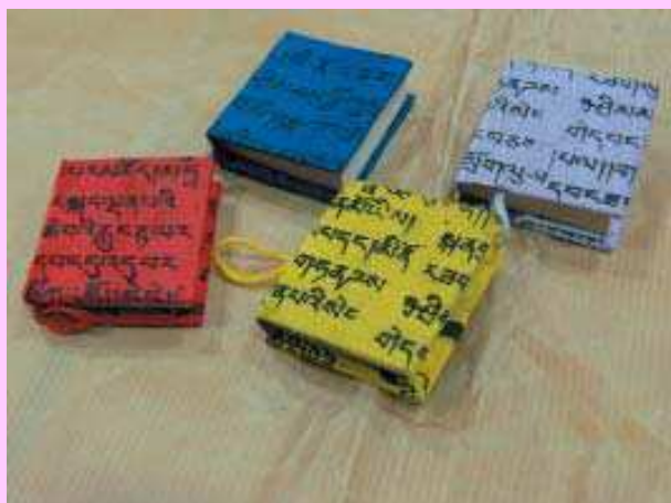
ref. 400044 2.50€ CUADERNITO MINIATURA PAPEL