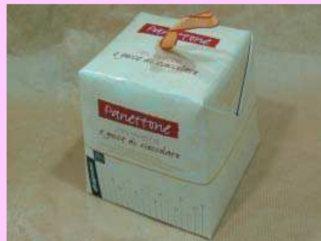
ref.909009 2.50 € PASTEL PANETTONE