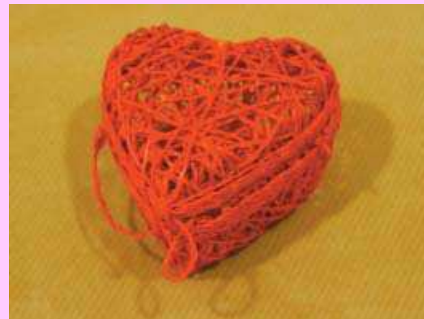
ref. 160054 3.50€ CAJITA CORAZÓN BBC