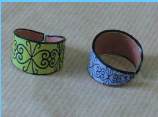
ref.200049 2.50€ ANILLO CUERO ANCHO COLORES