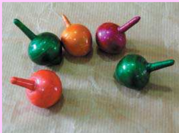
ref.630038 1.50 € PEONZA MADERA PINTADA