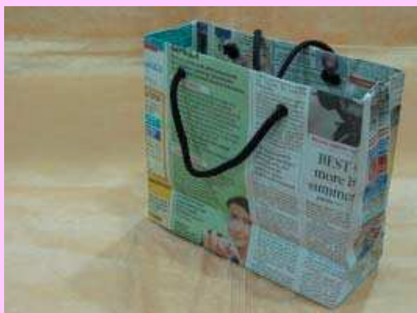
ref. 190014 0.50€ BOLSA PAPEL RECICLADO PEQUEÑA