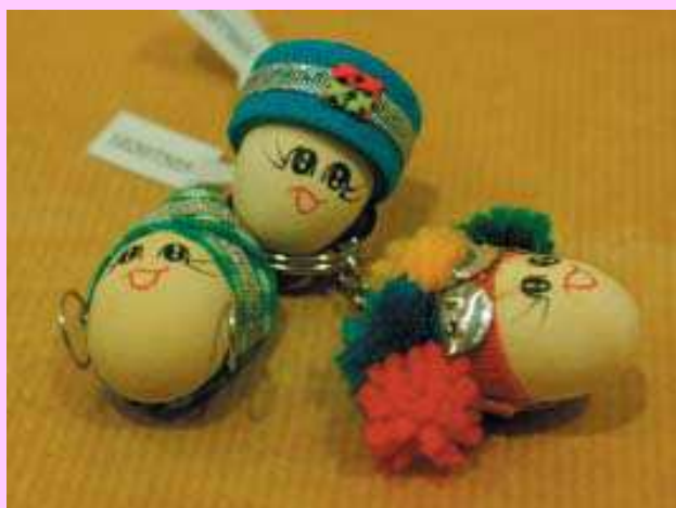
ref. 352050 2.50€ LLAVERO CABEZA DISEÑOS SURTIDOS