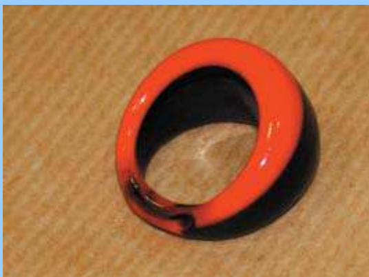
ref.200040 2.50€ ANILLO DE CRISTAL NEGRO Y ROJO.