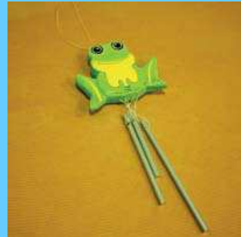
ref. 120054 3.50 € MÓVIL RANITA SONSORA 17CM