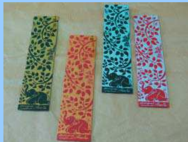
ref. 189940 2.00€ MARCAPAGINAS COLORES SURTIDOS