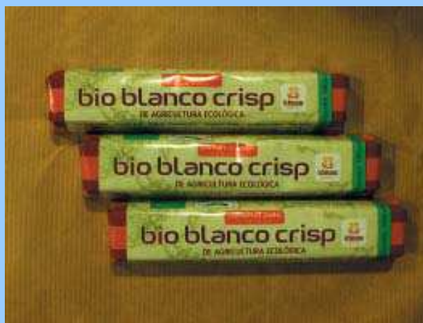
ref.900000 1.50 € BIO IO BLANCO CRISP