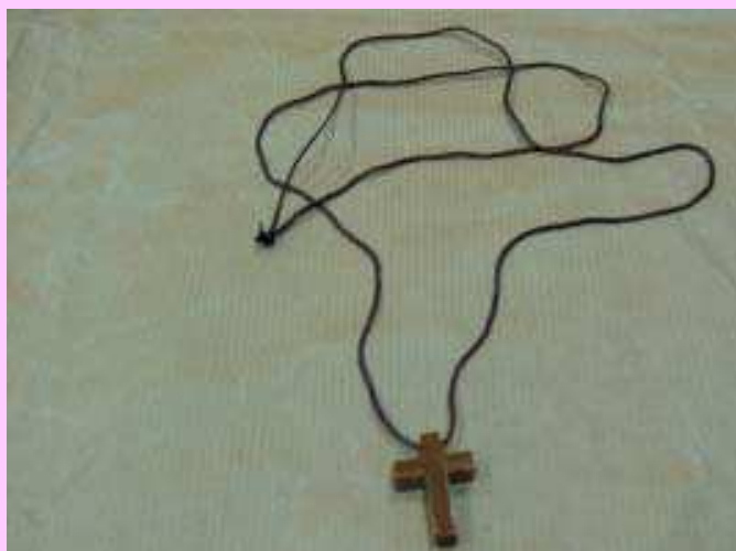
ref.220064 2.00€ COLGANTE CRUZ DE MADERA