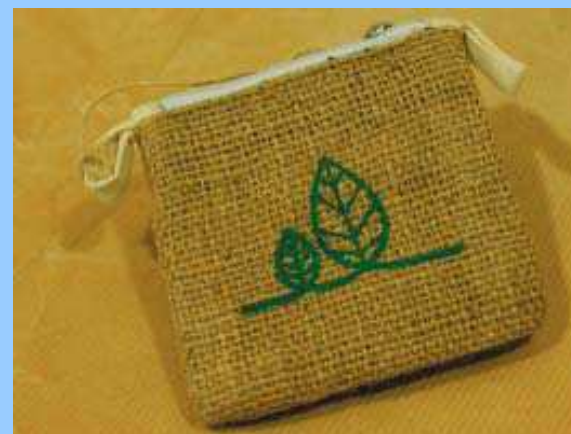
ref.306022 2.50€ MONEDERO DE YUTE